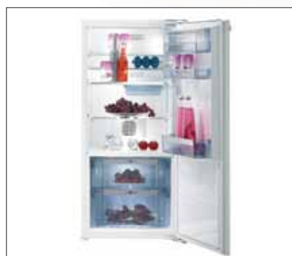
Kühlschrank | Modell: RI 56208 W