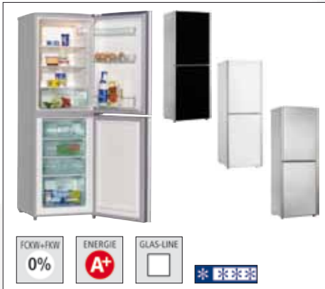
4*-Kühl-Gefrier-Kombination Modell: KGC 25201 S schwarz