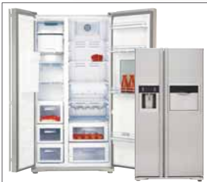
Modell: KWD 9440 X A+