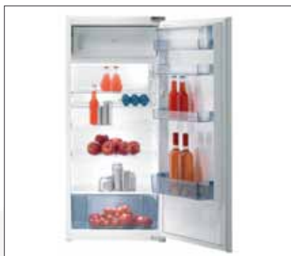
Kühlschrank | Modell: RBI 41219 W