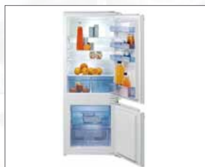
Kühl-Gefrier-Kombination | Modell: RKI 4238 W