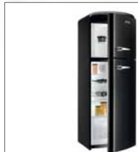
Stand-Kühl-Gefrier-Kombination, Linie OldTimer Modell: RF 60309 OBK (schwarz)