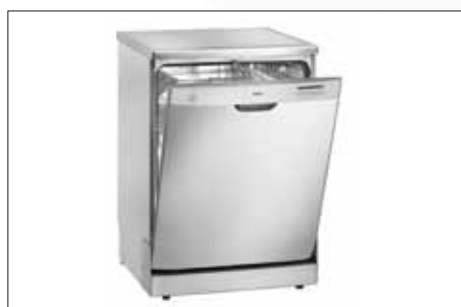
Geschirrspüler 60 cm | Modell: GSP 14055 E