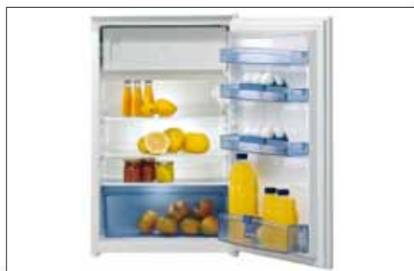
Einbau-Kühlschrank | Modell: RBI 4148 W