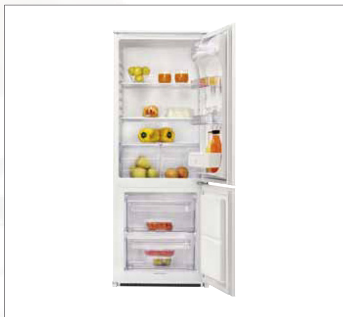
Nische 145 cm **** Kühl-/Gefrierkombination 495 € Modell: ZBB 3244

Nutzzinhalt Gesamt: 240 Liter, Nutzzinhalt Kühlen: 170 Liter, Nutzzinhalt Gefrierraum: 70 Liter, 3 höhenverstellbare Glasablageböden, 3 Gefriergut-Schubladen, Türanschlag wechselbar, Schlepptürtechnik, Energieeffizienzklasse A