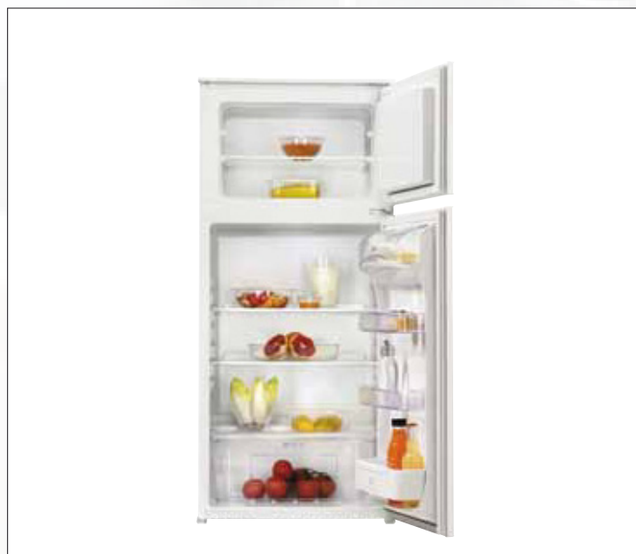
Nische 123 cm Kühl-/Gefrierkombination****