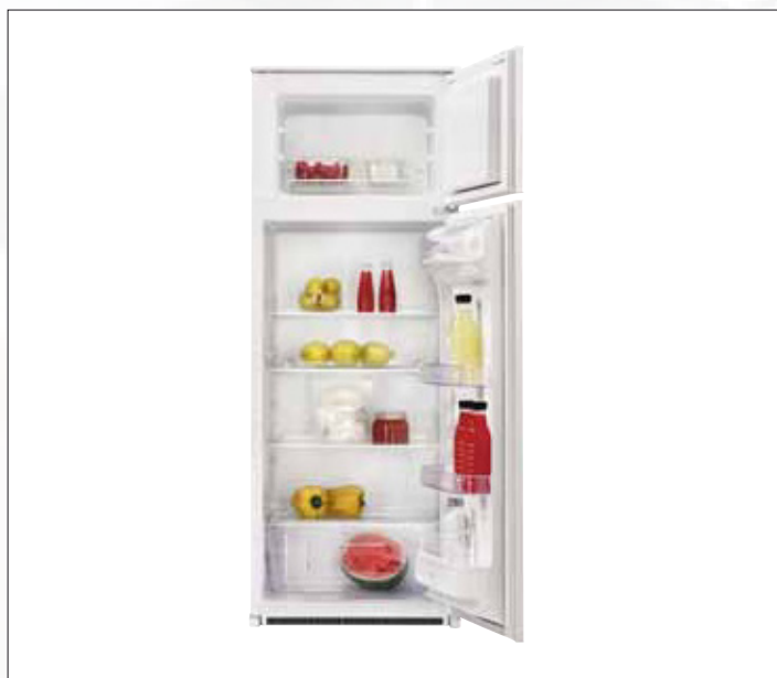
Nische 145 cm Kühl-/Gefrierkombination **** 456 € Modell: ZBT 3234

223 l Nutzzinhalt, davon 53 l ****-Gefrierteil, automatische Abtauung im Kühlteil, 2 höhenverstellbare Glasablageböden, 1 Glasablageboden über den 2 Gemüseschalen, 2 Gefriergut-Schubladen, Schlepptürtechnik, Energieeffizienzklasse A