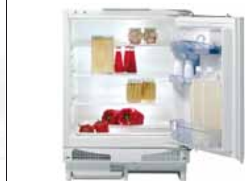
Unterbaufähiger Kühlschrank | Modell: RIU 6158 W