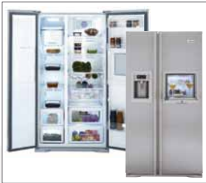
Modell: GNE V422 X