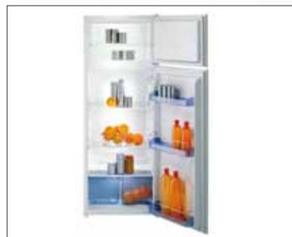
Kühl-Gefrier-Kombination | Modell: RFI 4248 W