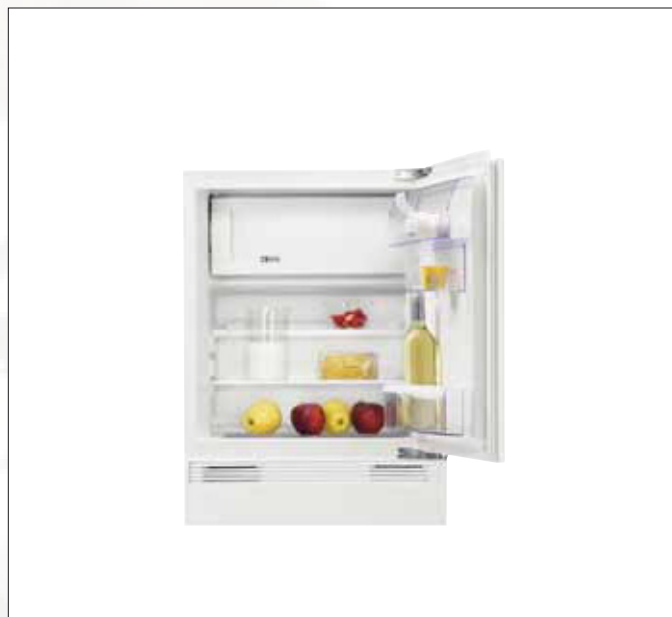
Nische 82 cm Integrierbarer Unterbau-Kühlschrank