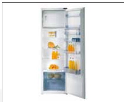
Kühlschrank | Modell: RBI 41319 W