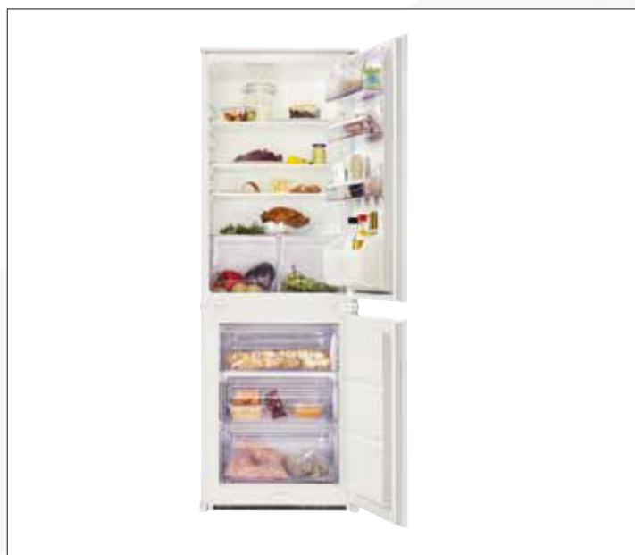
Nische 158 cm **** Einbau-Kühl-/Gefrierkombination 458 € Modell: ZBB 6254

Nutzzinhalt Gesamt: 240 Liter, Nutzzinhalt Kühlen: 170 Liter, Nutzzinhalt Gefrierraum: 70 Liter, 3 höhenverstellbare Glasablageböden, 3 Gefriergut-Schubladen, Türanschlag wechselbar, Schlepptürtechnik, Energieeffizienzklasse A