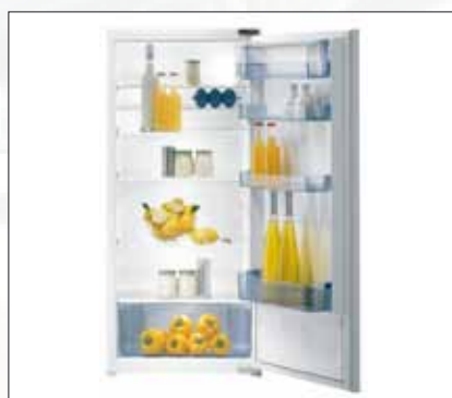
Kühlschrank | Modell: RI 41229 W