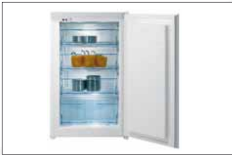
Gefrierschrank | Modell: FI 4118 W