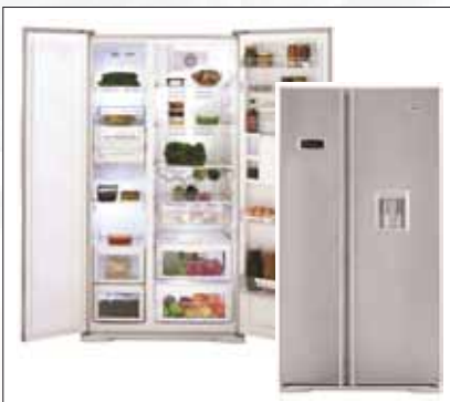
Modell: GNE V222 S