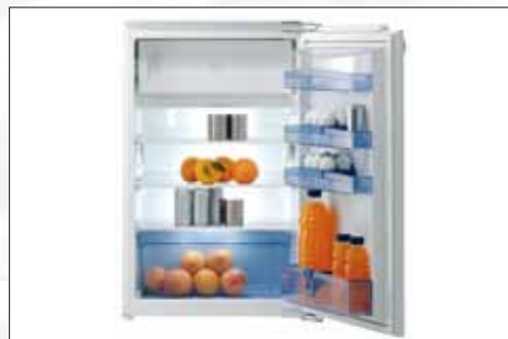
Einbau-Kühlschrank | Modell: RBI 5149 W