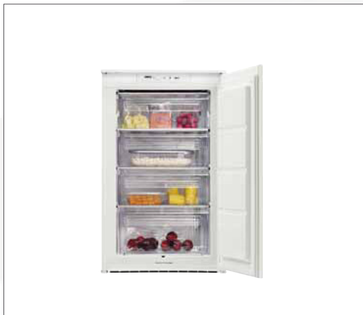
Nische 88 cm Integrierbarer Gefrierschrank