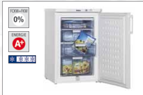
4*-Gefrierschrank | Modell: GS 15204