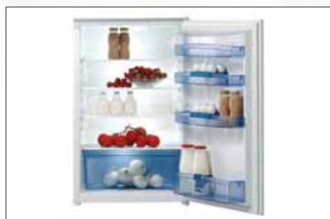
Einbau-Kühlschrank | Modell: RI 4158 W